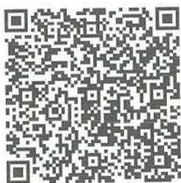
「標準的な運賃」の告示

なお、これら多くの課題を踏まえ、国土交通省では、令和2年4月より、「標準的な運賃」の告示をしており、県内のほとんどのトラック運送事業者より、この届出があつておりますことを申し添えます。