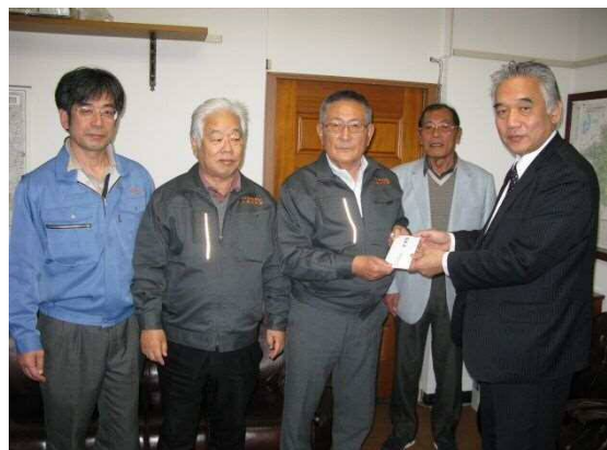
(3月27日 上益城支部へ見舞金20万円を贈呈)

3月3日に熊本県へ「ふるさとくまもと応援寄附金」として30万円拠出しております。