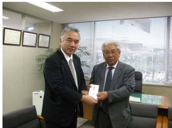
(3月24日 熊本支部へ見舞金20万円を贈呈)