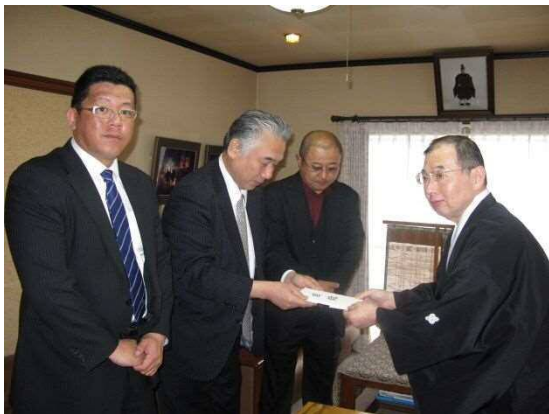
(3月24日 阿蘇神社へ奉賛金40万円を贈呈)