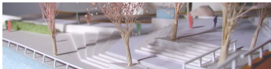
景観デザイン模型(白川・緑の区間)