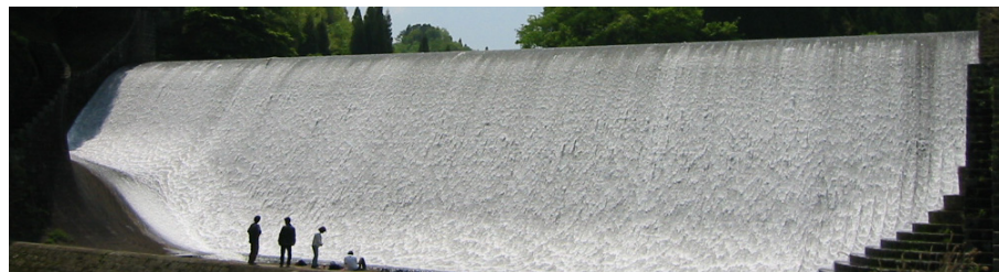
土木史研究(大分・白水堰堤)