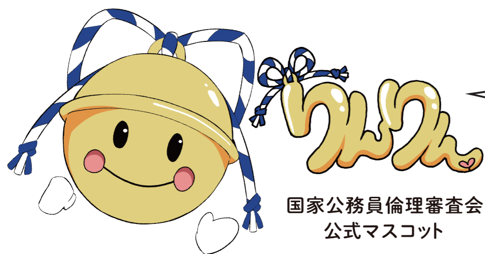
国家公務員倫理審査会 公式マスコット